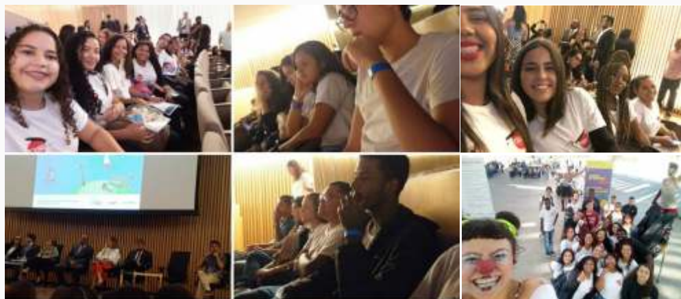
Jovens da Unidade Rio de Janeiro no evento de lançamento da campanha 12 de Junho pelo Fórum Nacional de Prevenção e Erradicação do Trabalho Infantil – FNPETI