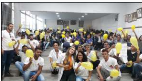
Semanas Pedagógicas Setembro Amarelo