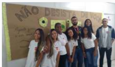
Jovens aprendizes da Unidade de Salvador em campanha de conscientização contra o suicídio.