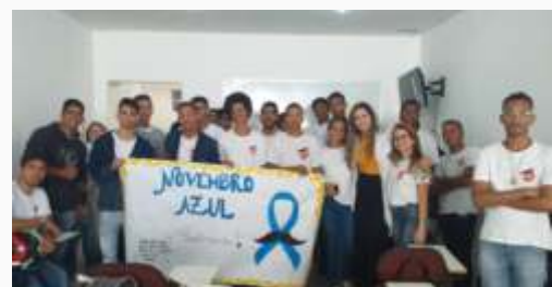
Jovens aprendizes da Unidade de Fortaleza em campanha contra o câncer de próstata.