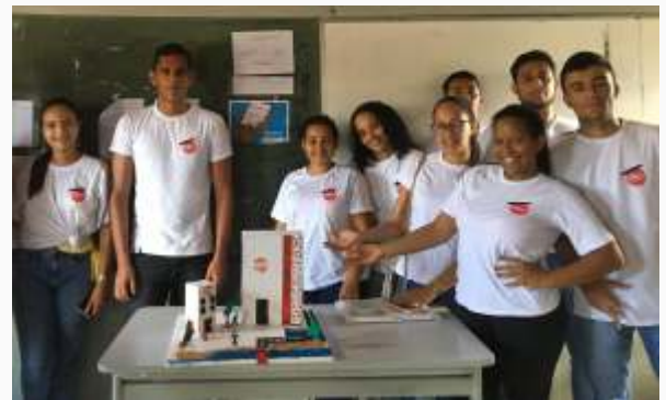
Ribeira do Pombal – foto da turma