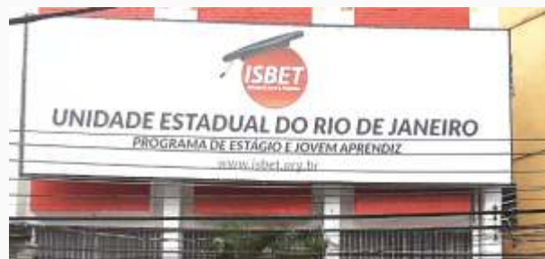
Novo endereço unidade estadual do Rio de Janeiro