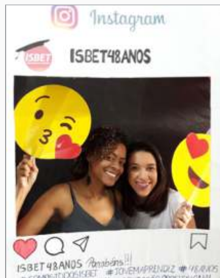
Comemoração 48 Anos ISBET