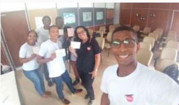
Ceasa- uma foto da turma