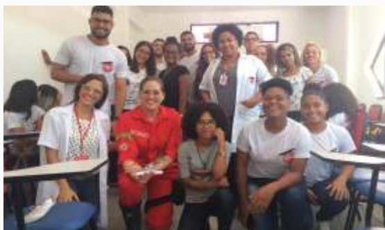
III conferência das profissões - Camaçari