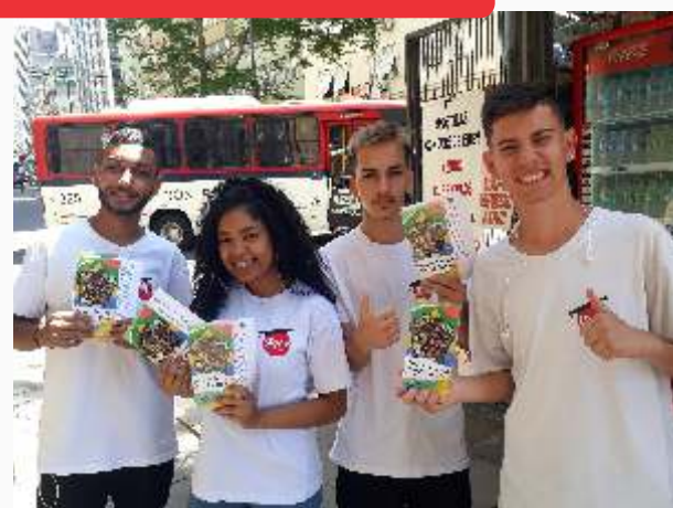
Ação de divulgação do aniversário da Declaração Universal dos Direitos Humanos Na esquina democrática.