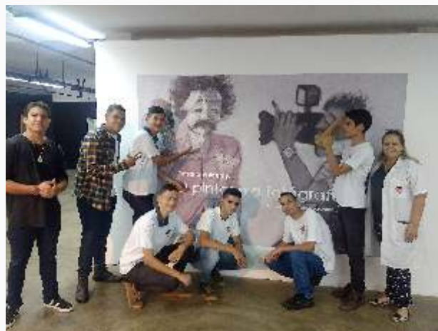
Visita Museu de Arte de Goiânia