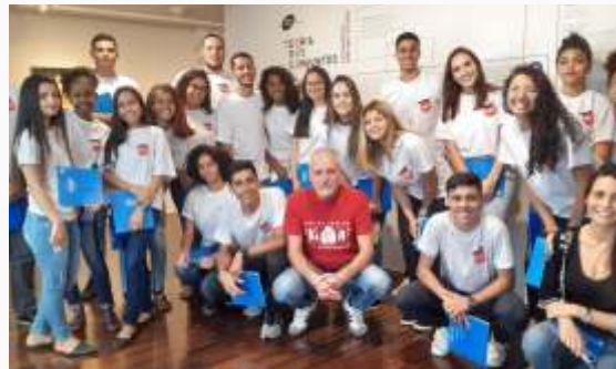
Participação dos aprendizes no evento da caixa cultural "teoria dos conjuntos", com o fotógrafo Bruno Veiga