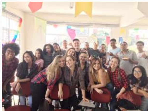
Festa junina com a turma de jovens aprendizes unidade Santos/SP