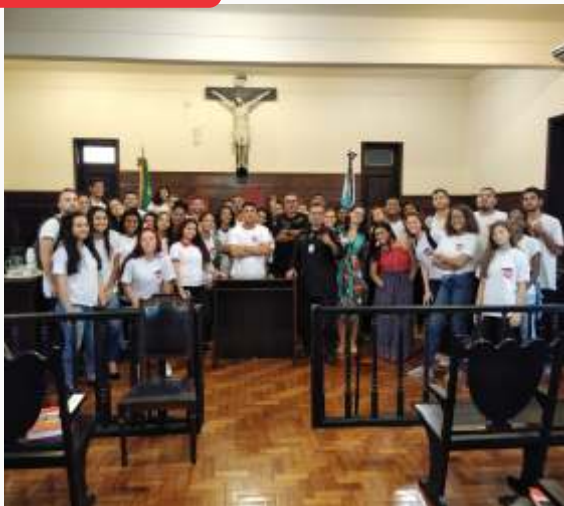
Visita guiada a Paquetá