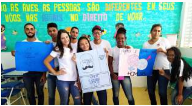
Esplanada – Novembro Azul