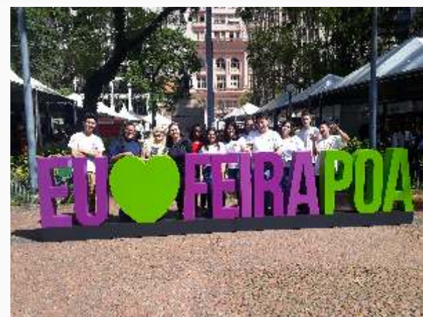
Projeto livro sem fronteiras Feira do livro em Porto Alegre.