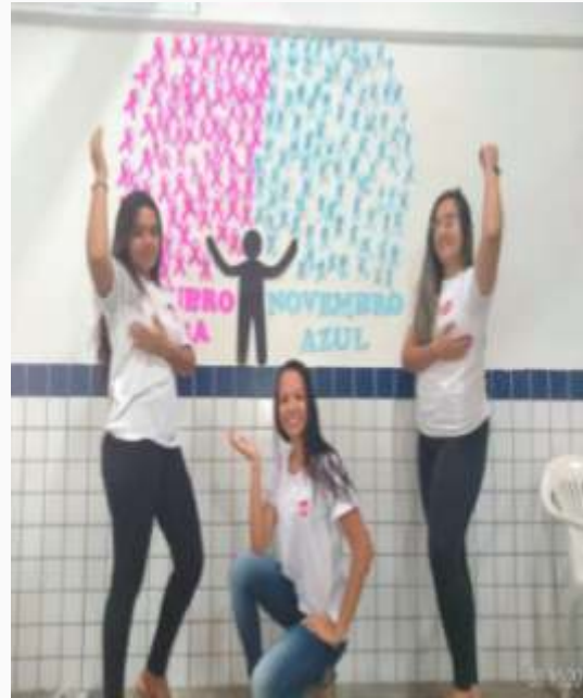
Jovens aprendizes da Unidade de Fortaleza em campanha contra o câncer de mama.