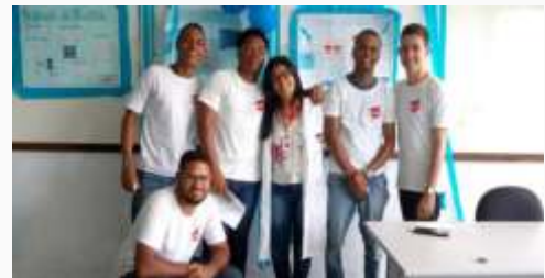
Jovens do Polo Candeias em seminário tendo como tema o Câncer de Próstata.