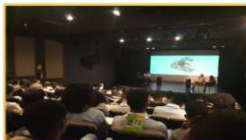
Jovens da Unidade de Brasília em participação em palestra no SESC com o tema focal: suicídio.