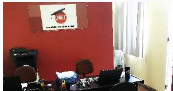
Novo endereço unidade municipal de Niterói.