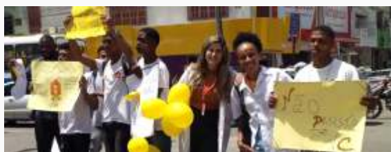
Jovens da Unidade de Feira de Santana em caminhada do abraço, com intuito de promover a empatia nas comunidades entorno à Instituição.

Durante o mês de Setembro, os jovens aprendizes de todas as Unidades realizaram atividades de conscientização para o Setembro Amarelo, onde sentimos a importância de realizar uma campanha de conscientização sobre a temática, pautando na prevenção, na troca de informações e cuidados básicos sobre o suicídio enquanto questão de saúde.