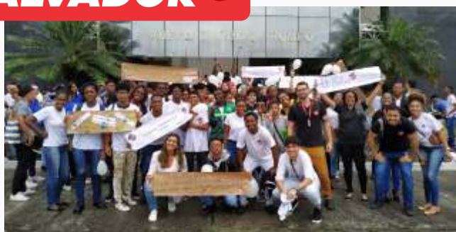
O isbet fez parte da comissão organizadora da manifestação Em defesa da lei de aprendizagem, que ocorreu em frente a Assembléia Legislativa da Bahia. Movimento pacífico com participação ativa dos jovens, órgãos competentes e a melhor parte foi o resultado positivo.