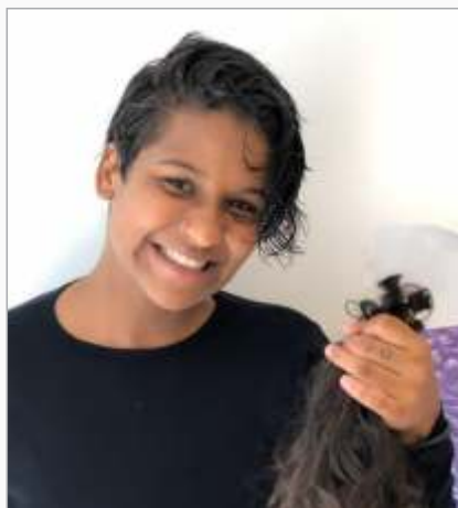
Doação de cabelo, por parte de aprendizes para o Hospital de Base de Brasília, objetivando a confecção de perucas para pacientes com câncer de mama