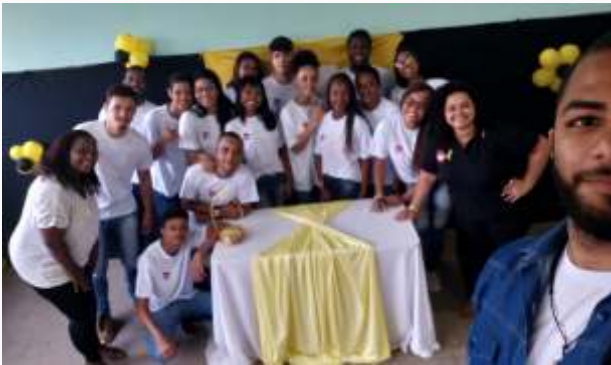
Valença – Setembro Amarelo