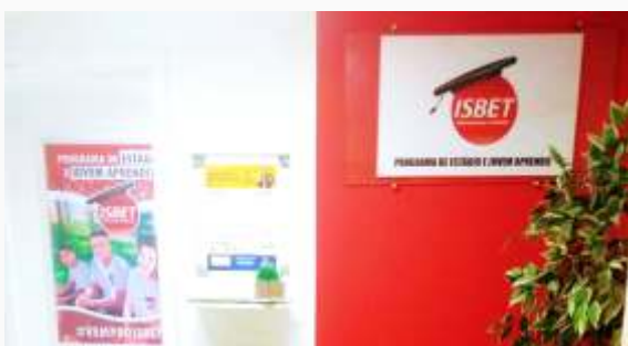
Novo endereço unidade Barra da Tijuca – Rio de Janeiro