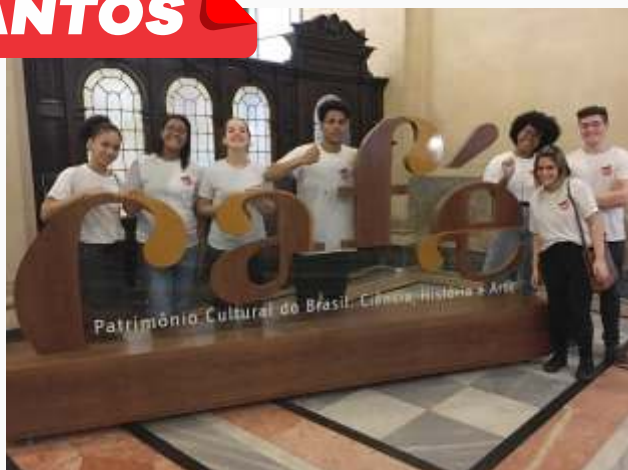
Visita guiada - Palácio da bolsa oficial do café