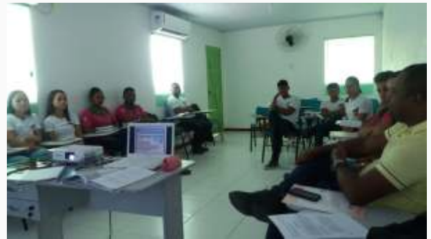
Conde – debate em sala de aula