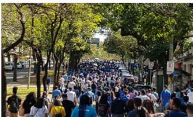
Mobilização a favor da aprendizagem