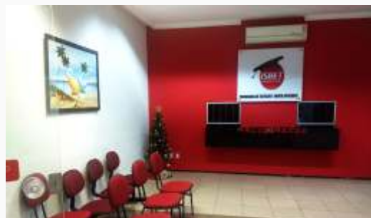
Novo endereço unidade estadual do Ceará