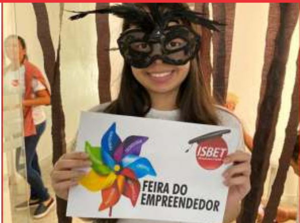
Atividades pedagógicas em capacitação