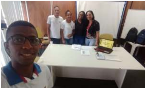
Ceasa- Setembro Amarelo