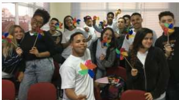
Jovens da Unidade de Santos confeccionaram cata-ventos, símbolo da luta contra o Trabalho Infantil.