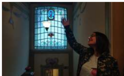
Jovens da Unidade de Santos em Visita ao Museu Histórico Local.