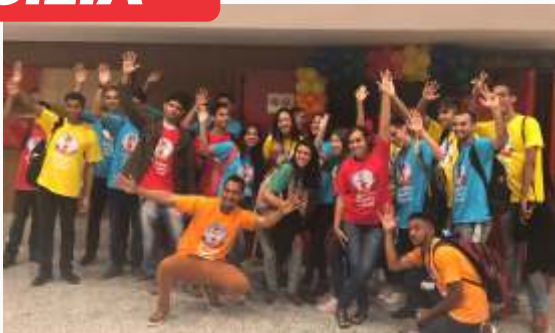
Participação dos aprendizes a convite do Ministério Público do Trabalho à solenidade de premiação do projeto resgate à infância - MPT na escola 2019