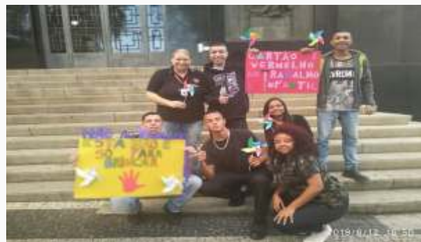
Jovens da Unidade de Campinas fazendo "Luto" pela realidade do trabalho infantil em frente ao Palácio da Justiça em Campinas.

Esta semana foi marcada por atividades pedagógicas com o intuito de sensibilizar não só os jovens como a comunidade em que a Instituição está inserida a refletir sobre as consequências do trabalho infantil e importância de garantir as crianças e aos adolescentes o direito à brincar, estudar e sonhar.