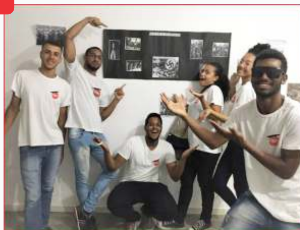
Atividades pedagógicas em capacitação