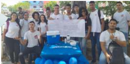
Intervenção na Praça Monte Negro, no centro de Camaçari.

O intuito desta semana pedagógica foi proporcionar aos jovens aprendizes uma vivência na temática através da participação em atividades como: palestras, rodas de conversas, dentre muitas possibilidades, a conscientização e o esclarecimento sobre a importância da prevenção do câncer de próstata, através do diagnóstico precoce.