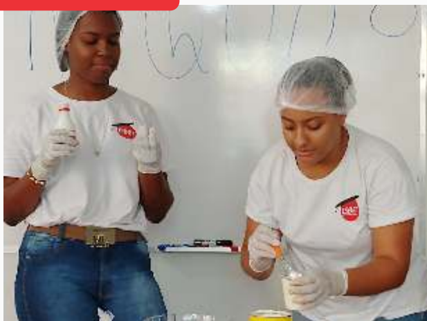
Oficina controle de qualidade