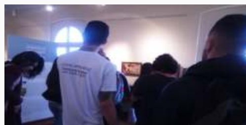
Jovens da Unidade de Curitiba em uma visita guiada ao Museu da Imagem e do Som do Paraná.