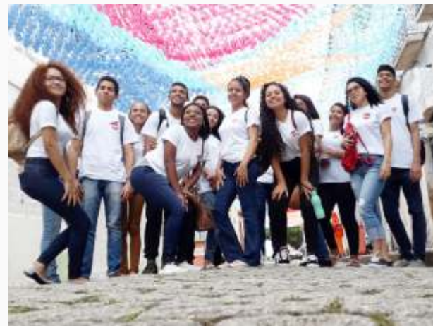
Turma de administrativo – visita guiada ao Centro Histórico de São Luís – junho/2019