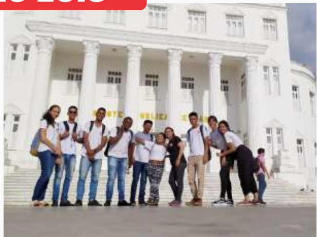
Turma: atendimento/comércio Visita técnica: Biblioteca Pública Benedito Leite Módulo: língua portuguesa – outubro/2019