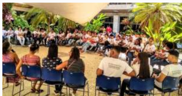
Em parceria com o CRAS de Ilha de Maré, jovens meninas relataram para as jovens aprendizes do isbet como é ser mulher e cuidar da saúde residindo em uma ilha distante do centro da cidade. Foi um debate rico que fez parte do projeto outubro rosa.