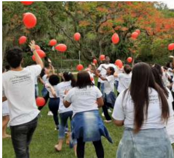
Todos se divertiram na dinâmica de integração!!