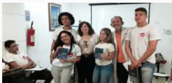
Oficina de escrita e poética ministrada pela poetisa cearense e finalista do prêmio Jabuti, com entrega de exemplares da obra da autora para os jovens organizada pela Unidade de Fortaleza.

Esta semana pedagógica teve como principal intuito proporcionar aos jovens aprendizes o contato com o que é belo, estimulá-los a frequentar museus, teatros, oficinas artísticas e aguçar o senso crítico-reflexivo acerca de materializações artísticas.