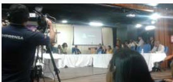
Jovens da Unidade de Camaçari em participação na Assembleia sobre o Setembro Amarelo.