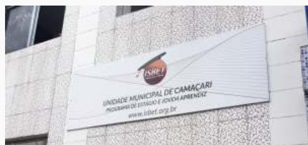
Novo endereço unidade municipal de Camaçari