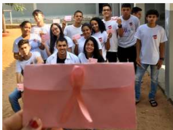
Semanas Pedagógicas Outubro Rosa