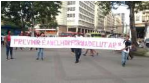
Jovens da Unidade de Niterói – Rio de Janeiro em campanha de conscientização do diagnóstico precoce do Câncer de Mama na comunidade em torno da Instituição