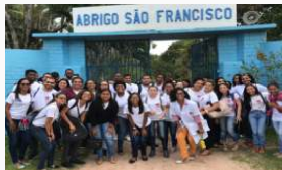
Visita ao abrigo de idosos São Francisco de Assis